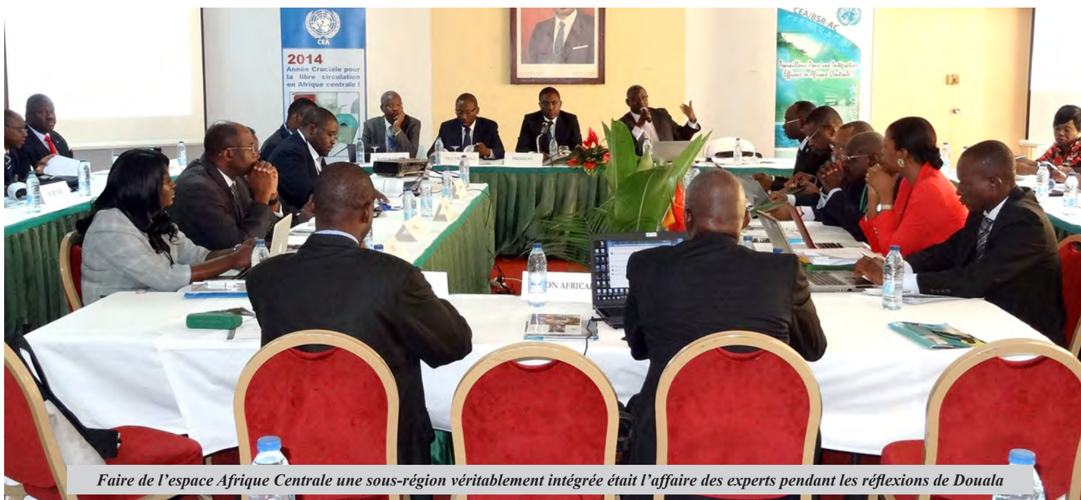
Faire de l'espace Afrique Centrale une sous-région véritablement intégrée était l'affaire des experts pendant les réflexions de Douala

Après deux jours de réflexion sur l'intégration économique et sociale en Afrique centrale et sur la libre circulation des personnes au cours de réunion d'experts sur la rationalisation des outils d'intégration du marché de la CEEAC et de la CEMAC et de la troisième édition des Journées de l'Intégration en Afrique Centrale tenues en Octobre 2013 à Douala, au Cameroun, les experts de la sous région conviés par la CEA ont formulé des recommandations pratiques pour faire de l'espace Afrique centrale une sous-région véritablement intégrée en vue d'un développement plus rapide et durable pour tous ses Etats membres.