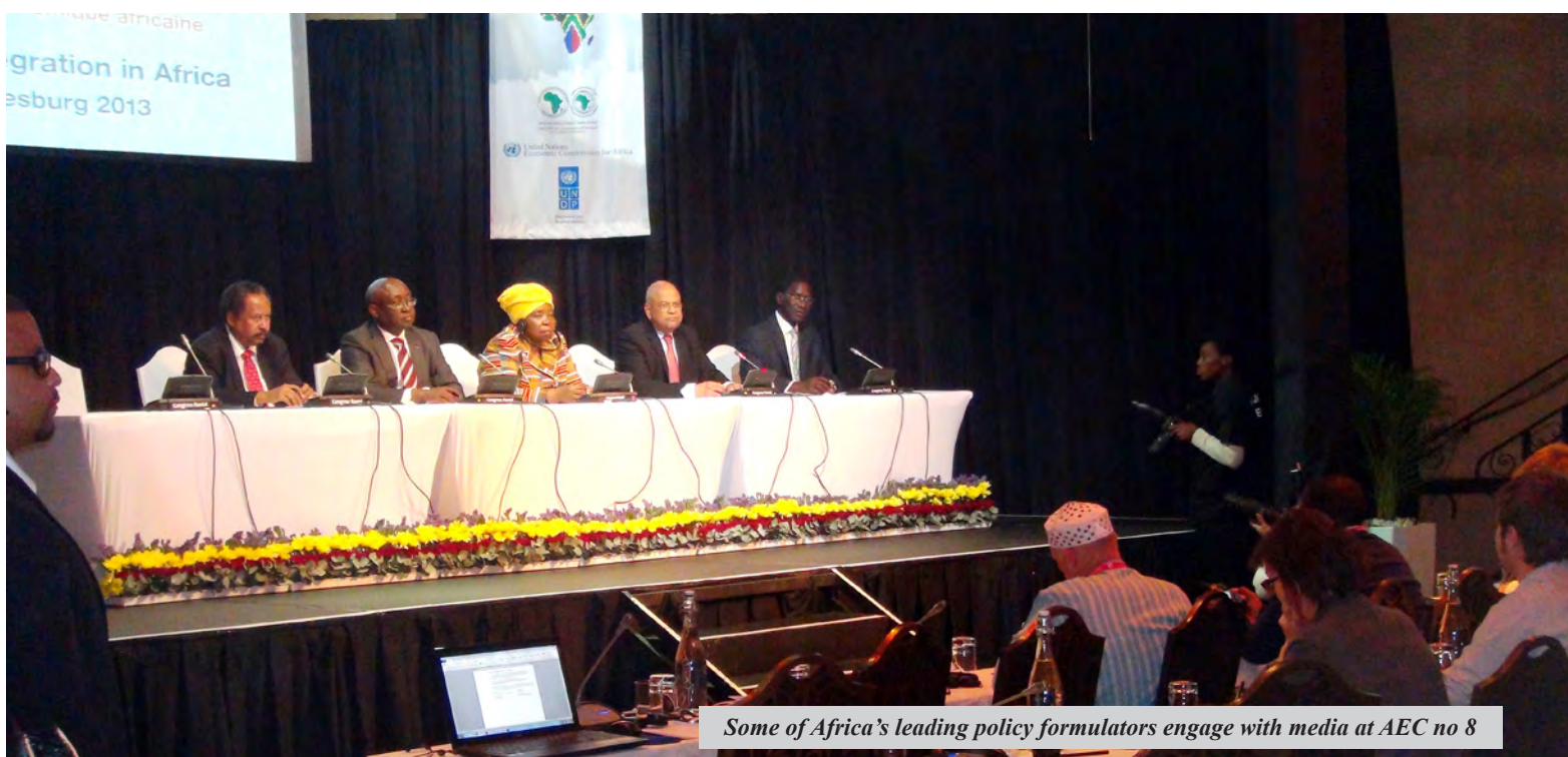
Some of Africa's leading policy formulators engage with media at AEC no 8

Debates at the 8th African Economic Conference jointly organised by ECA, AfDB and AUC in Johannesburg, South Africa, from 28 to 30 October 2013 were “sharp,” to go by the local dictum. They strongly focused on regional integration, echoing the point that Africa had reached the turning point but not the tipping point of its journey to development. African leaders needed to fully buy in to the discourse of structural transformation that pays attention to industrialisation and value addition with consistent effort to improve and sustain high growth rates by the continent “trading with itself”. In this conjuncture, research pieces presented on Central Africa showed that the sub-region needed to work even harder in the department of regional integration. We revisit the findings summarily below.