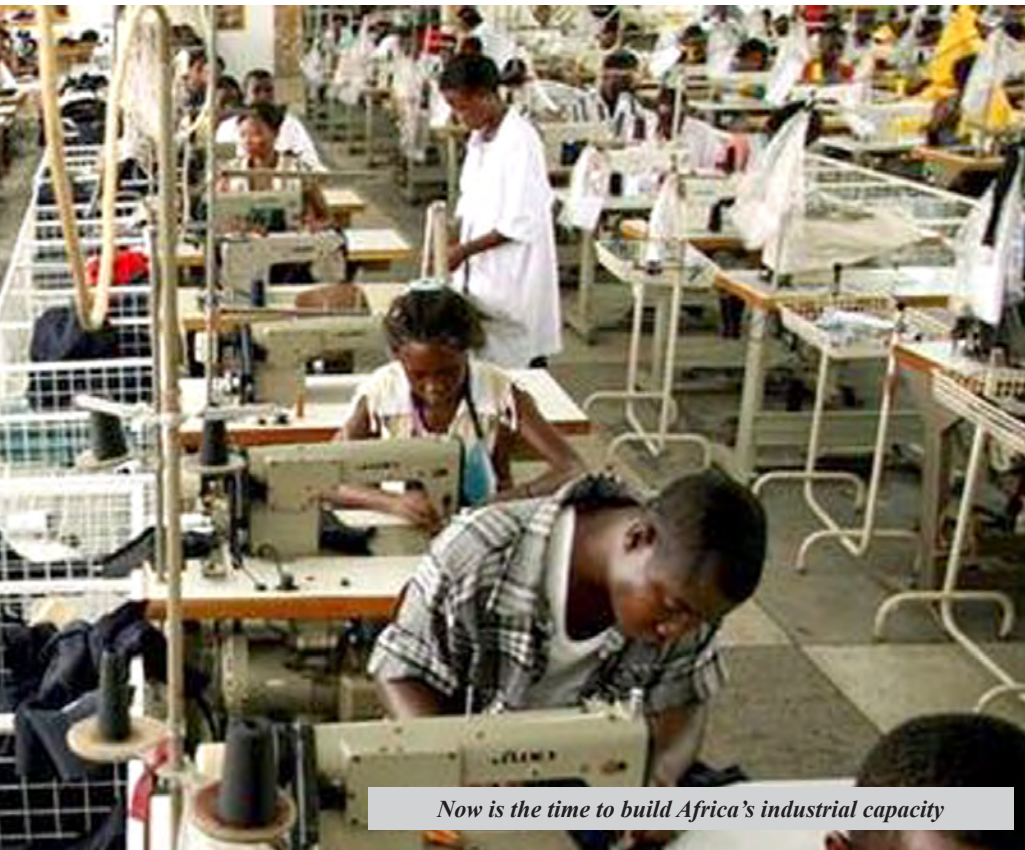
Now is the time to build Africa's industrial capacity

On 20 November 2013, the United Nations Economic Commission for Africa (ECA) actively joined the United Nations Development Organization (UNIDO), the African Union Commission (AUC) and Cameroon's Ministry of Mines, Industry and Technological Development to Celebrate the 24th Africa Industrialisation Day under the theme: "Job creation and entrepreneurship development: A means to accelerate industrialisation in Africa".