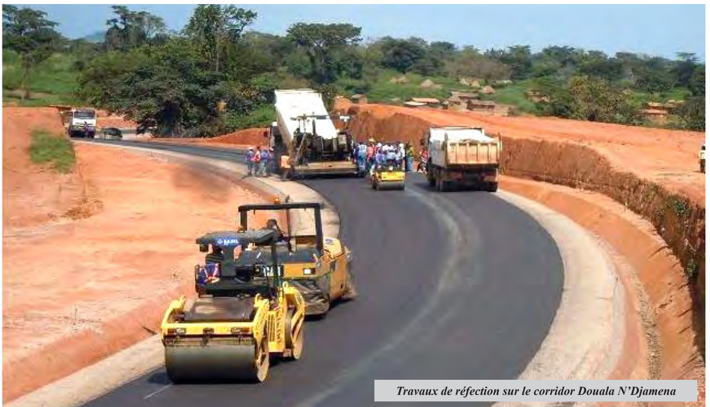
Travaux de réfection sur le corridor Douala N'Djamena