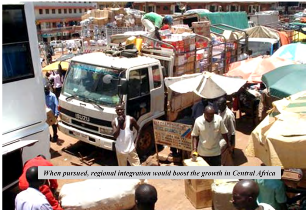
When pursued, regional integration would boost the growth in Central Africa

Lien pour le document : http://bit.ly/1Noybv