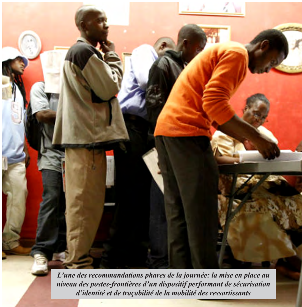
L'une des recommandations phares de la journée: la mise en place au niveau des postes-frontières d'un dispositif performant de sécurisation d'identité et de traçabilité de la mobilité des ressortissants

les partenaires techniques et financiers à appuyer l'organisation d'un Forum des parlementaires de la sous-région sur les questions de libre circulation des personnes et de droit d'établissement en Afrique Centrale et de poursuivre les actions de plaidoyer auprès des Etats membres et des CER en vue d'accélérer le processus d'intégration en Afrique Centrale.