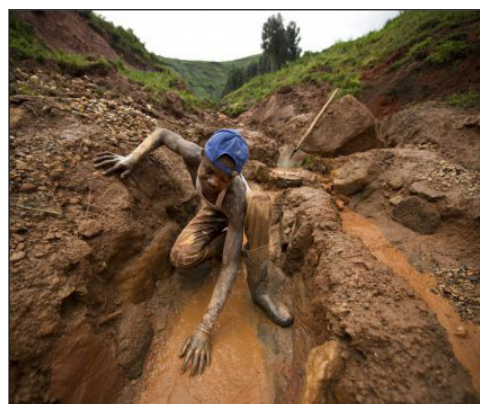
In search of coltan in the DRC

Towards the 3rd African Governance Report