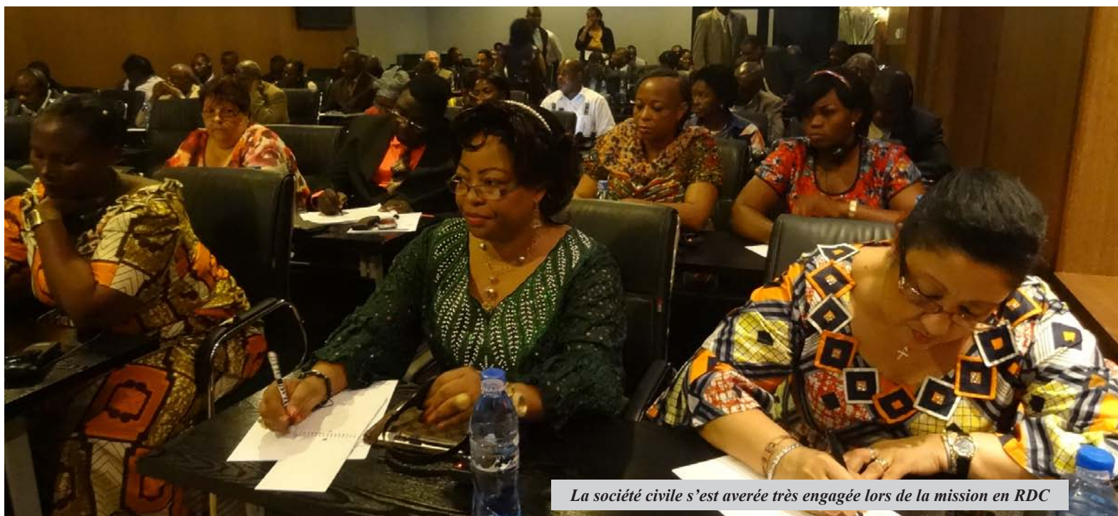
La société civile s'est avérée très engagée lors de la mission en RDC

Lors de leur séjour à Kinshasa, S.E. M. Thabo Mbeki et les autres membres du GPHN sur les Flux financiers Illicites en provenance de l'Afrique ont eu des échanges franches avec une soixantaine des membres de la société civile pour mieux comprendre la complexité de ce problème en RDC. Trouvez, ci-dessous, quelques extraits sur ce que pense la société civile en RDC sur la problématique de flux financiers illicites en provenance de leur pays.