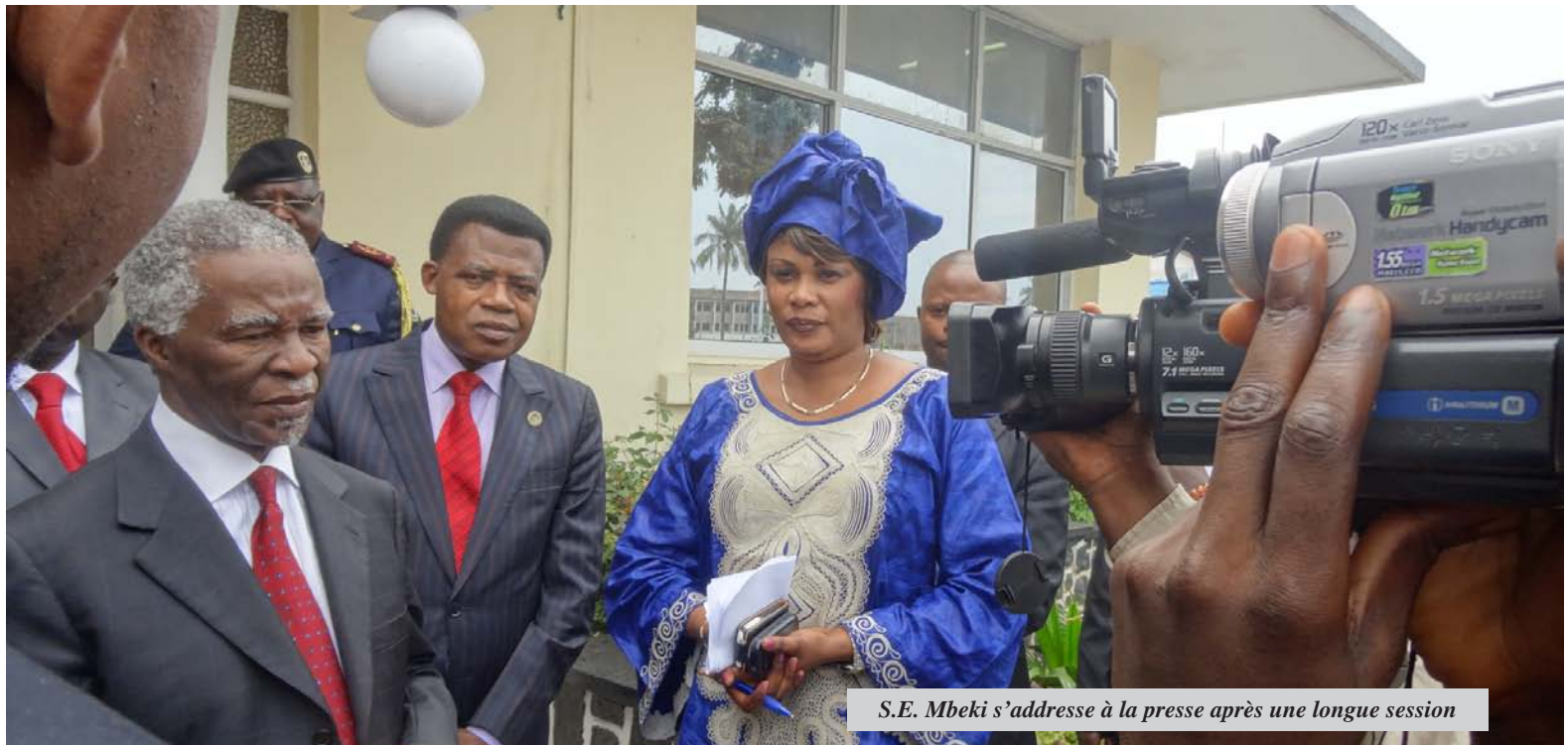
S.E. Mbeki s'adresse à la presse après une longue session

E n fin août 2013, des hauts responsables gouvernementaux, chefs des institutions parlementaires ainsi que des dirigeants de la société civile et du secteur privé de la République démocratique du Congo (RDC) ont fait part de leur impatience de voir des recommandations du Groupe de Personnalité de Haut Niveau sur les Flux Financiers en provenance de l'Afrique (GPHN) dirigé par l'ancien Président sud-africain, Thabo Mbeki, pour sortir leur pays des fuites de capitaux illicites injustifiés qui a coûté plus de 54 milliards de dollars au cours des quatre dernières décennies. Le GPHN, qui bénéficie de l'appui technique de la Commission économique des Nations Unies pour l'Afrique (CEA), a conclu