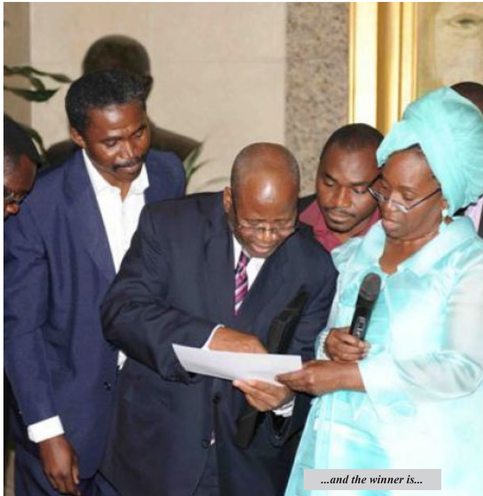
...and the winner is...