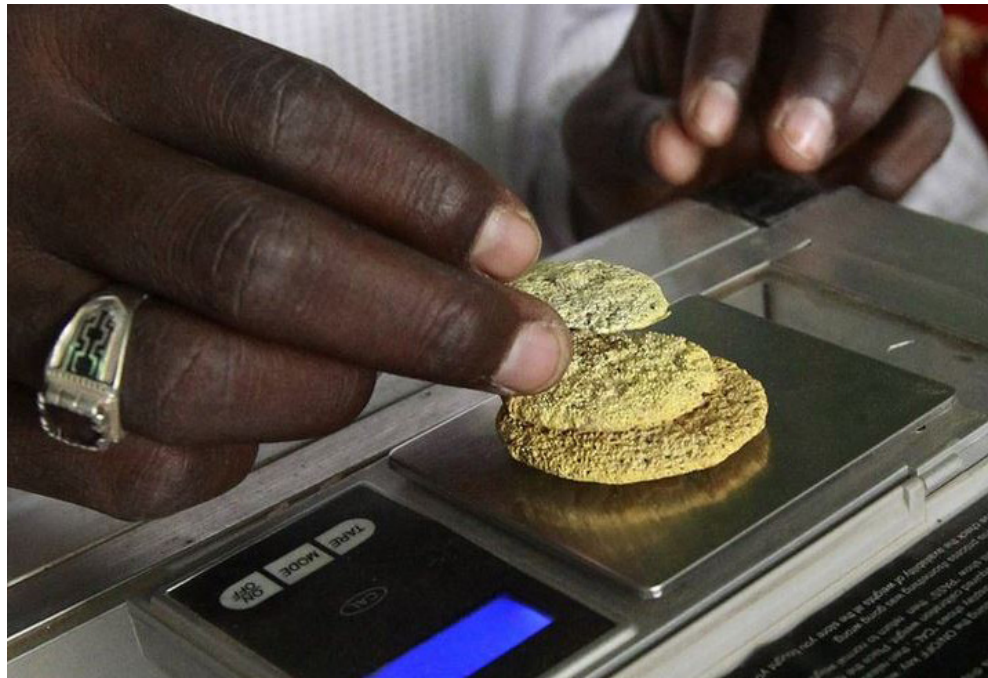
Qui paie quoi à qui ?

V ous êtes leader d'un des pays de l'Afrique centrale et vous êtes préoccupés par des programmes qui doivent mener votre pays vers le développement durable, des programmes pour faire décoller l'économie de votre pays vers l'émergence. Non seulement vous êtes conscient du fait que la route qui mène à cette destination est difficile, mais vous êtes hanté par la réalité que votre Etat fait face à une perte probable de 85 pour cent des revenus qui pourraient financer vos grands projets, vos grandes idées, du à des flux financiers illicites vers l'extérieure. Imaginez la frustration. C'est ce que nous avons constaté pendant notre récent séjour en République Démocratique du Congo (RDC) avec le Groupe de Personnalités de Haut Niveau sur les Flux financiers Illicites en provenance de l'Afrique. Les flux financiers illicites de capitaux d'un pays aussi riche en ressources naturelles comme la RDC, pourraient être l'une des plus grandes énigmes de ce pays vers un développement significatif. Mais la RDC n'est pas le seul. En fait, la région de la CEEAC dispose des pays pleins de potentiels de développement rapides en raison de leurs richesses naturelles surtout dans les secteurs extractifs, mais ceux-ci semblent marquer le pas sur la voie de la transformation éco-