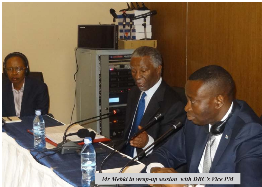
Mr Mbeki in wrap-up session with DRC's Vice PM

the Africa Union Conference of African Ministers of Economy and Finance and Economic Commission for Africa's Conference of African Ministers of Finance, Planning and Economic Development. The two institutions were given the mandate to coordinate the mission of the Panel, which started full-fledged work on 5 February 2012. The Panel's overall mission, which is to make clear recommendations of a generalised nature based on the specific experiences of the national case studies undertaken on curbing illicit financial flows from Africa, is considered crucial given current estimates that the continent now loses at least 50 billion dollars yearly due to illicit financial flows – a figure that exceeds the Official Development Assistance (ODA) it receives.