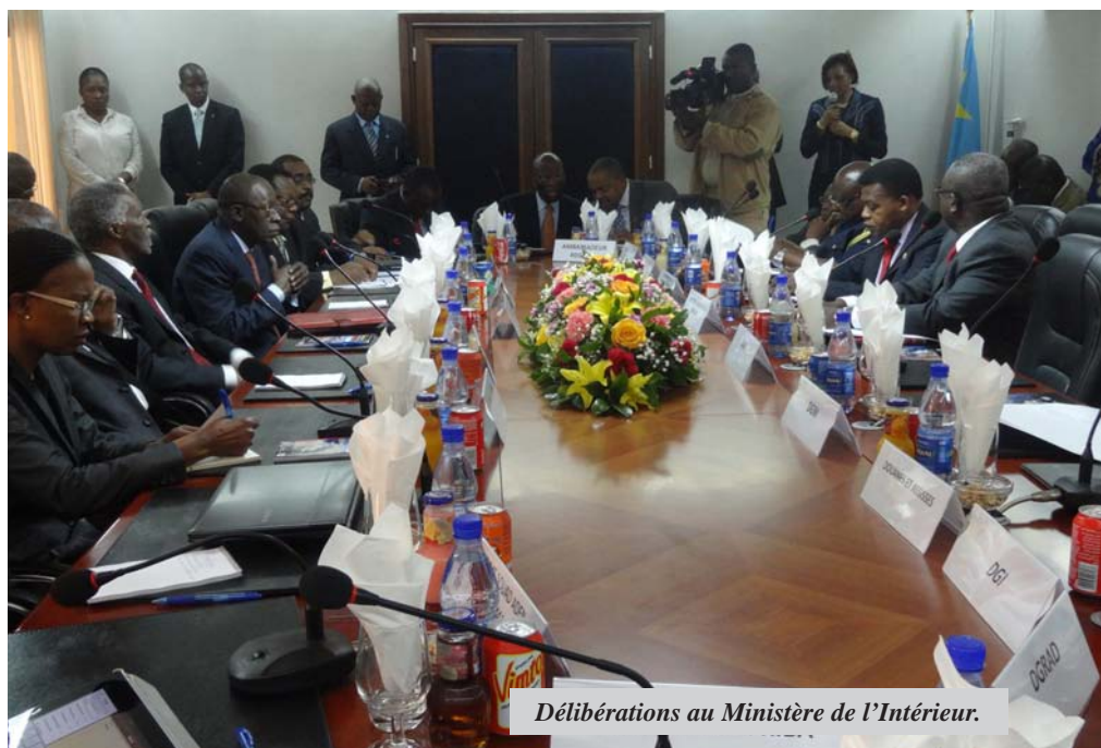
Délibérations au Ministère de l'Intérieur.

4èmeréunion annuelle conjointe de la Conférence des ministres africains de l'économie et des finances de l'Union africaine et la Conférence des ministres africains des finances, de la planification et du développement économique de la Commission économique pour l'Afrique. Les deux institutions ont reçu le mandat de coordonner la mission du Groupe, qui a commencé à travailler à part entière, le 5 février 2012. La mission globale du GPHN, qui consiste à formuler des recommandations claires sur la maîtrise des flux de capitaux illicites en provenance d'Afrique, est considérée comme cruciale étant donné les estimations actuelles que le continent perd actuellement, au moins 50 milliards de dollars par an en raison de flux de capitaux illicites – un chiffre qui dépasse l'aide publique au développement (APD) qu'il reçoit.