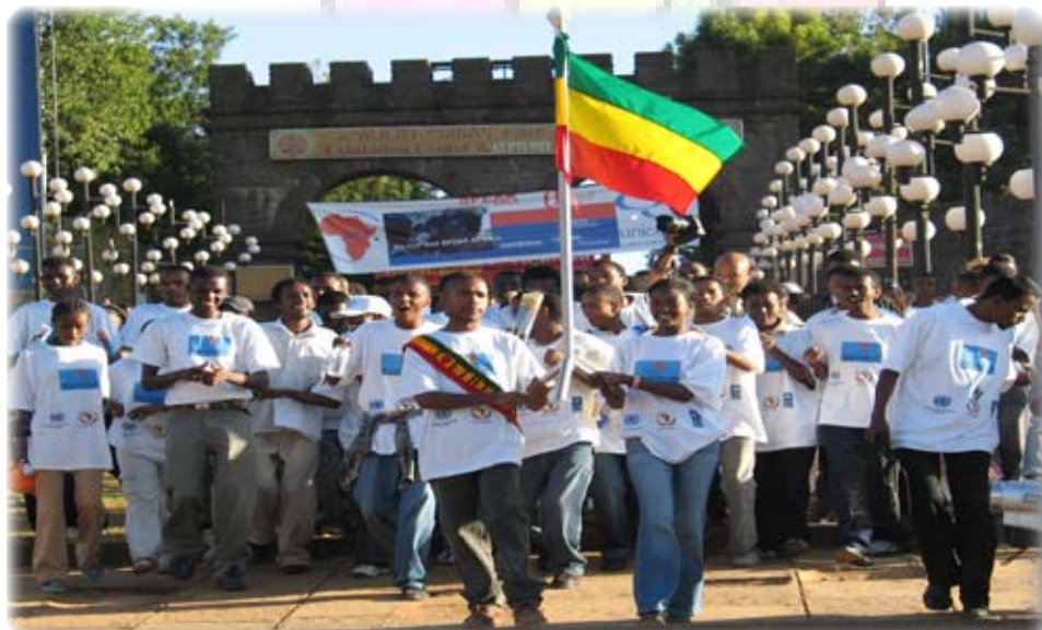
African youth walk for development on the continent during ADF V.

"As I lay down my global responsibilities I promise to devote myself more than ever to this beloved continent," he told ADF V.